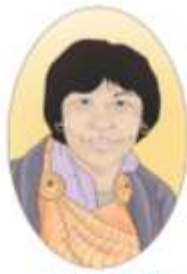
ཨ་མ་ཅུང་མ་