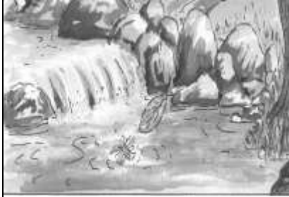
རྒྱུ་ལྷ་ལྷ་མ་འདུག།