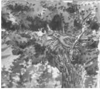
ཤིང་གྲུ་བྱ་འདུག།